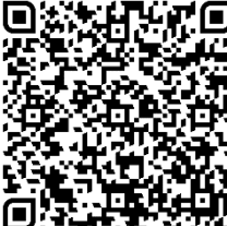
AGB HAUS AM SCHLOSSBERG