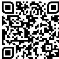
DIE SPITZBUBEN BÄCKER VIDEO