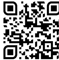
MITTAGSMENÜS BÄCKEREI MAIER